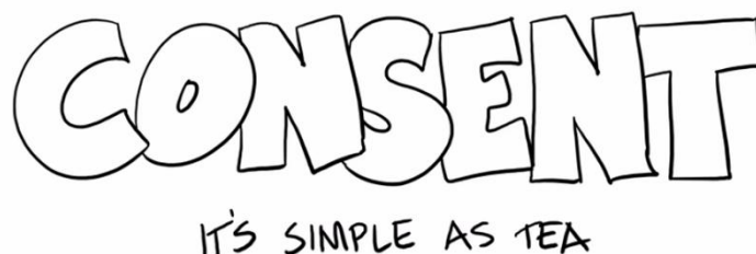
Фигура 2. Снимка от видеоклипа "Чай и съгласие". Blue Seat Studios

https://www.youtube.com/watch?v=pZwvrXVavnQ